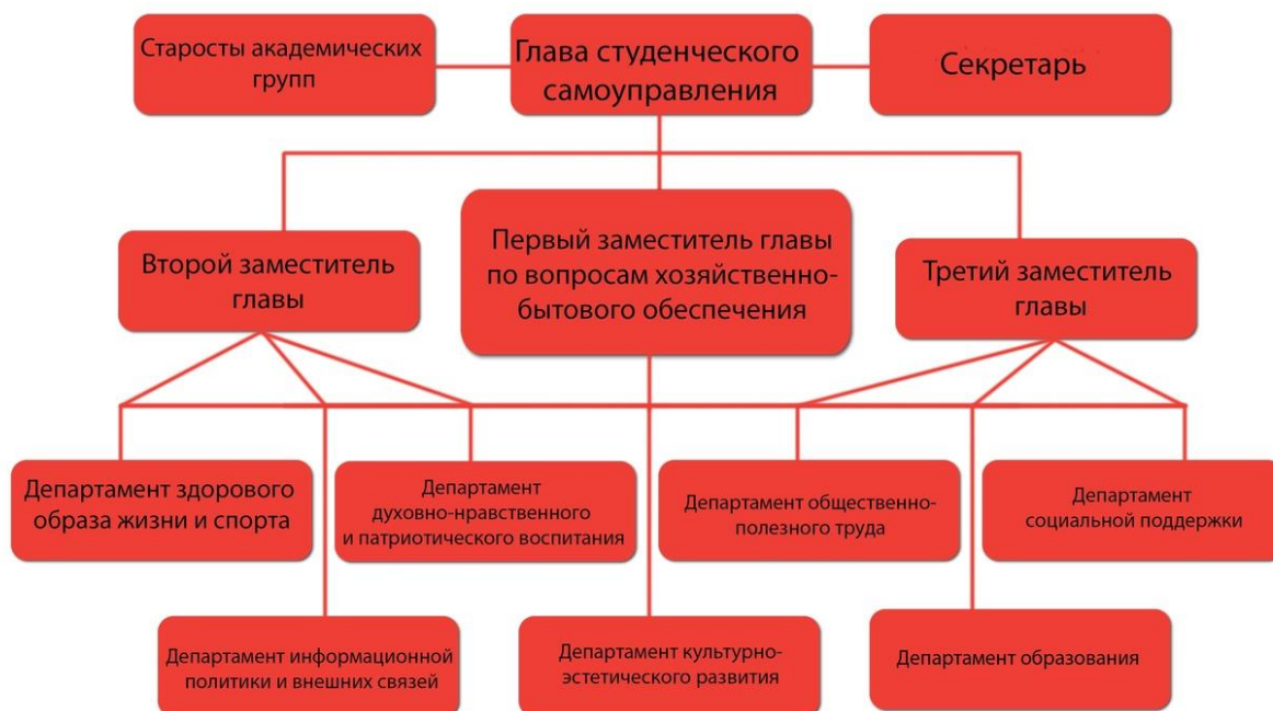
Схема 1 – Структура студенческого самоуправления ИИМОСПН

В ИИМОСПН функционирует студенческое самоуправление, структура которого соответствует структуре органов студенческого самоуправления ЛГПУ (см. схему 1).