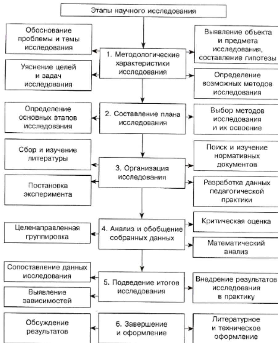
Рисунок 1 – Составляющие этапов научного исследования

Всякое научное исследование от творческого замысла до окончательного оформления научного труда весьма индивидуально. Но имеются и некоторые общие методологические подходы к его проведению, которые принято называть исследованием в научном смысле. В.И. Евдокимов, О.А. Чугунов предлагают придерживаться определенной схемы последовательности организации этапов НИР (рисунок 1).