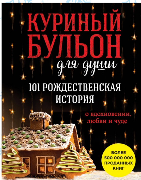
Обложка книги Дж. Кэнфилд и Ч. Эплин

Для зимнего вечера подойдет рассказ «Ёлка с сюрпризом». Это атмосферная проза, художественное действие в которой разворачивается в канун Нового года. Разбогатевший благодаря золотой жиле мужчина по имени Чероки решает перевоплотиться в Деда Мороза и вручить подарки чужим детям. Он не ожидает, что случайным образом не только подарит новогоднее чудо, но и сам будет вознагражден. После прочтения книги ты невольно начинаешь верить, что чудеса случаются, а судьба может преподнести подарок в самый неожиданный момент.