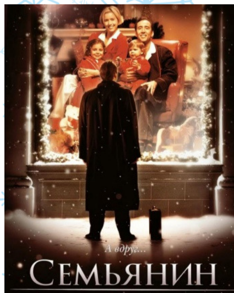
Постер фильма «Семьянин»

Новый год – это, несомненно, пора волшебства, тепла, уюта и десятка тематических фильмов, просмотр которых из года в год стал уже традицией. Но иногда под Новый год хочется нового в устоявшиеся порядки. Возможно, стоит нарушить обязательные просмотры «Одного дома» и «Москвы...», той, что слезам не верит, и пополнить новогодний список фильмов кинокомедией «Семьянин». Не совсем новинки, всего-то 2000-го года выпуска, зато идеальной для просмотра в кругу семьи.