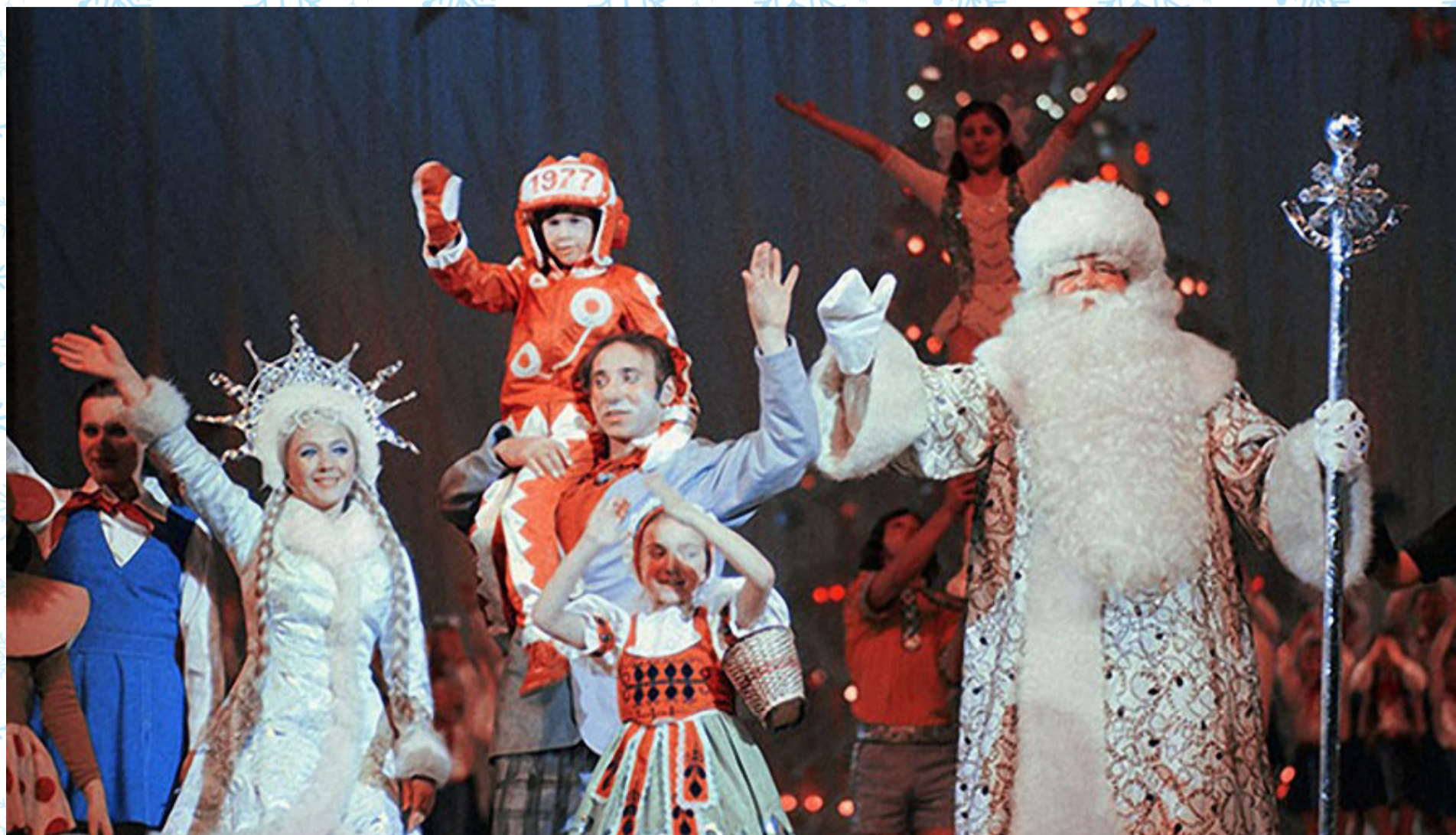
Новогодний «Голубой огонек»