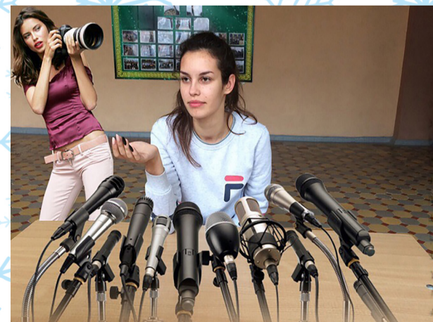
Как чувствует себя учитель-блогер

Победителей конкурса «Лучший учитель-блогер» в Instagram жюри «Педсовета» приглашает участвовать в своей Летней школе.