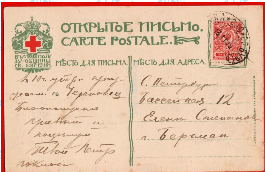
Открытка ок. 1917 г. Новгородская губерния, Община Святой Евгении