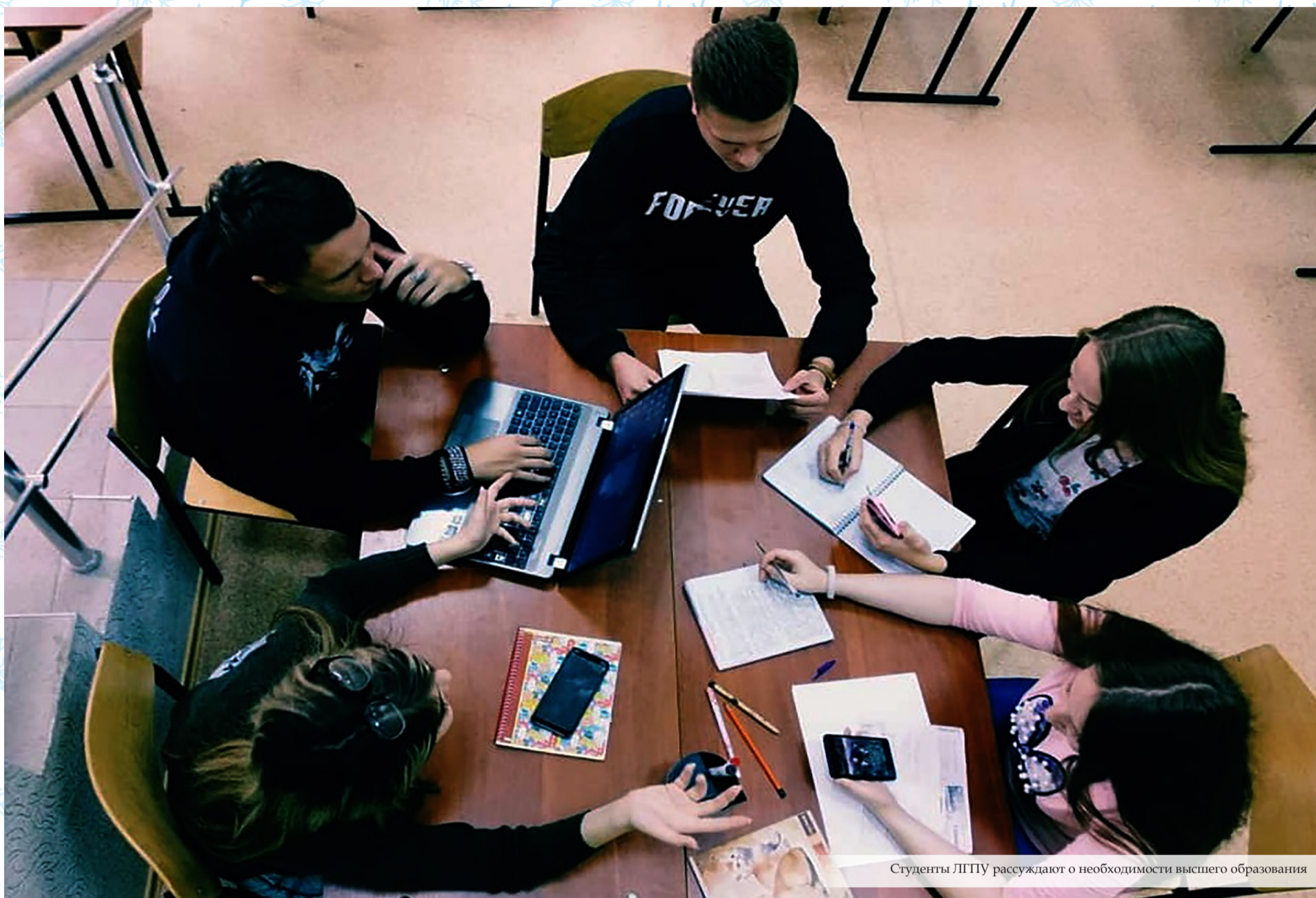
Студенты ЛГПУ рассуждают о необходимости высшего образования

и как взаимодействовать, чтобы работа была комфортной и продуктивной для всех сторон познавательного процесса? На эти вопросы мы нашли ответы у практикующих учителей и научных деятелей.