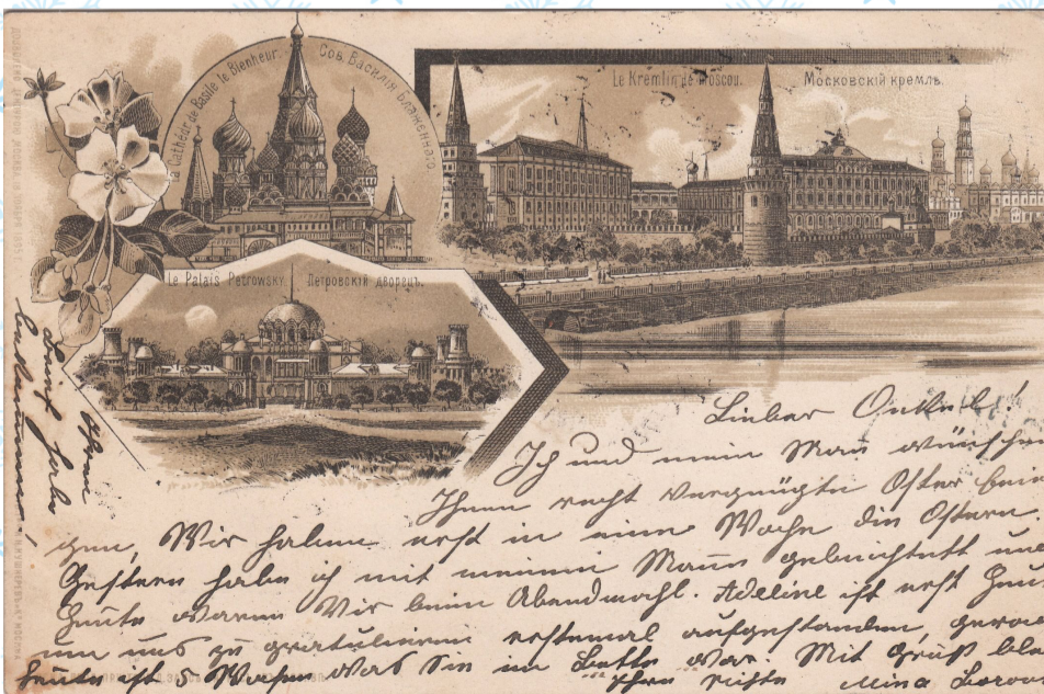
Открытка с видами Москвы. Кремль, Красная площадь, Петровский дворец

студентка первого курса направления подготовки «Журналистика»