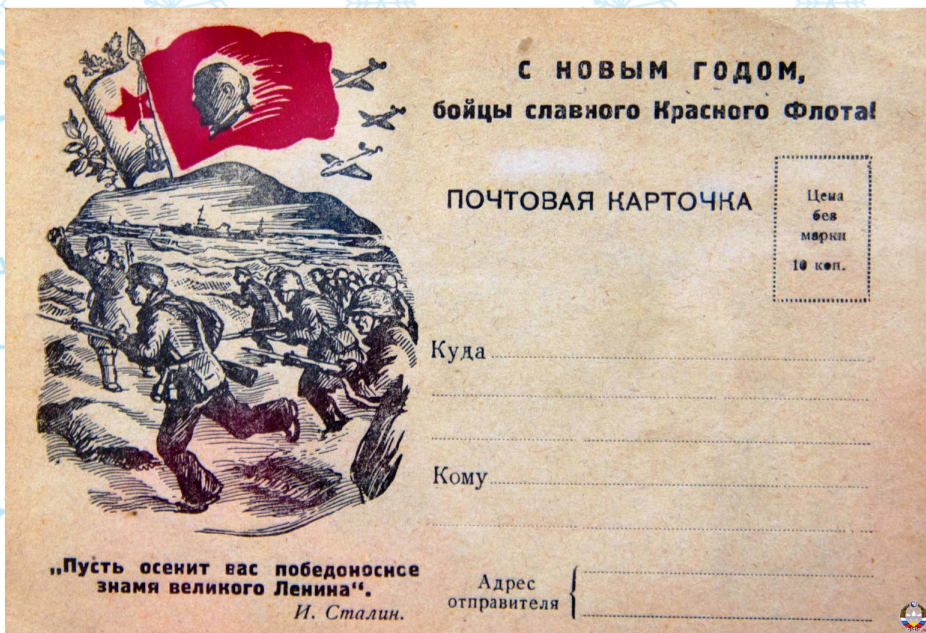
Почтовая карточка «С Новым годом, бойцы славного Красного Флота!»