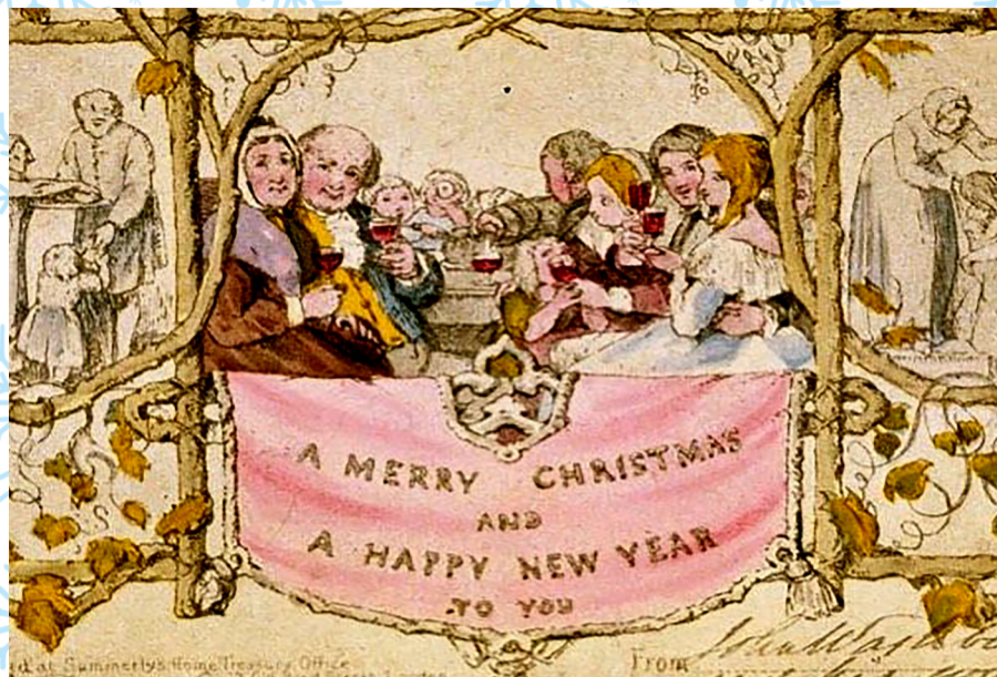
Открытка Джона Хорсли