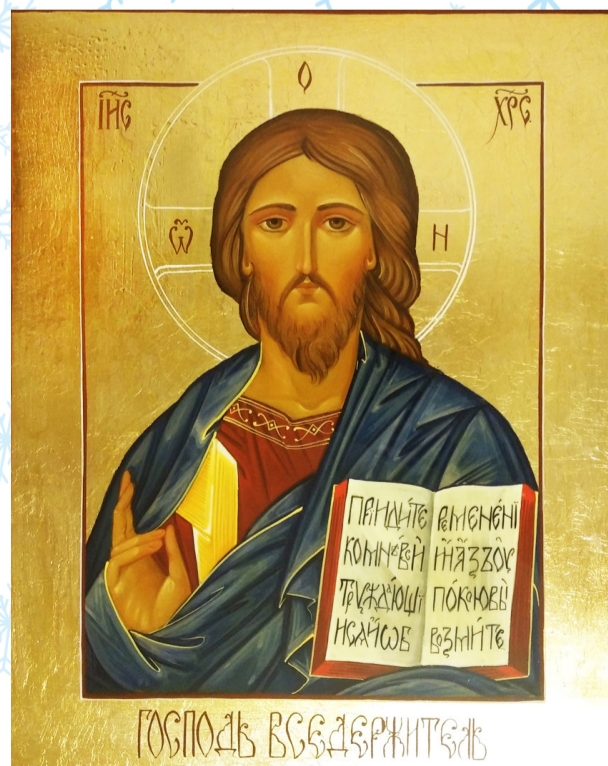
«Спас Вседержитель» 40x50 см темпера, левкас, поталь, липа