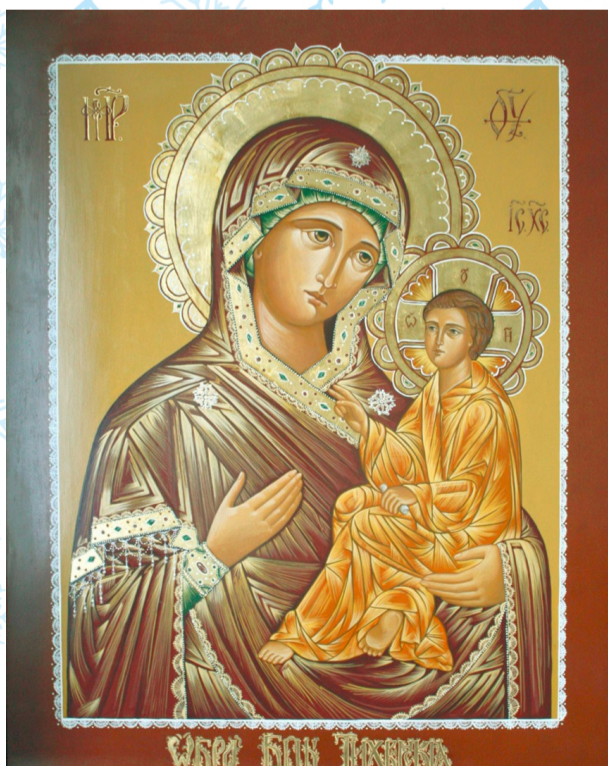
«Тихвинская икона Божией Матери» 100x80 см темпера, поталь, доска