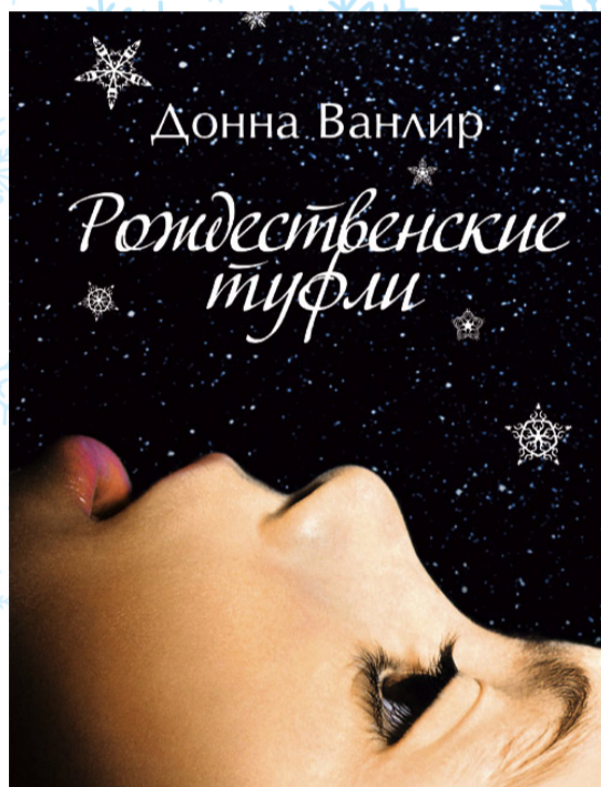
Обложка книги Д. Ванлир

Чудеса под Новый год случаются в жизни каждого человека: будь-то какая-то мелочь или исполнение мечты всей жизни. Каждый получает желаемое, обретает счастье и в новом году становится другим человеком. В книге содержится 101 небольшая история, от которых невозможно оторваться. Возможно, вы станете не просто свидетелем чужого новогоднего чуда, но и поверите в то, что оно также возможно и для вас.