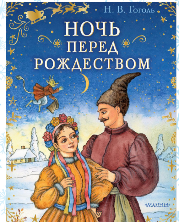
Обложка книги Н. Гоголя