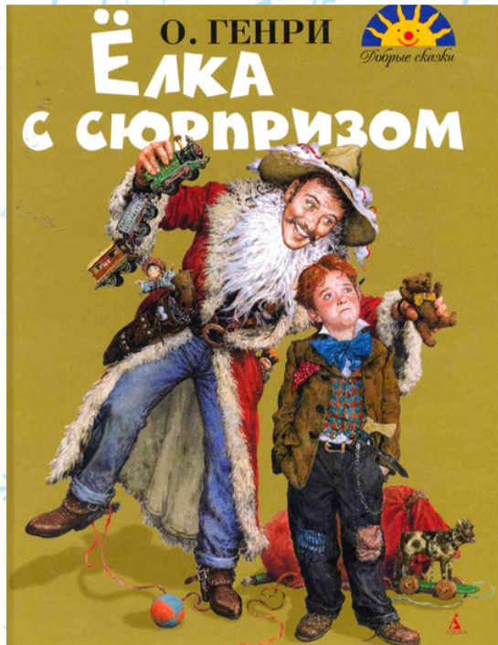
Обложка книги О. Генри

Что может быть приятней предновогодней суеты, покупок подарков и украшения своего дома разноцветными гирляндами? Наверное, наслаждение зимней атмосферой и ожидание вот-вот случившегося новогоднего чуда. Снежным декабрьским вечером всегда хочется окунуться в сказку, поверить, что чудеса возможны в жизни каждого из нас, нужно лишь заметить их.