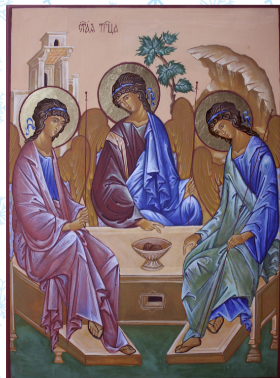
«Святая Троица» 30x40 см темпера, поталь, доска