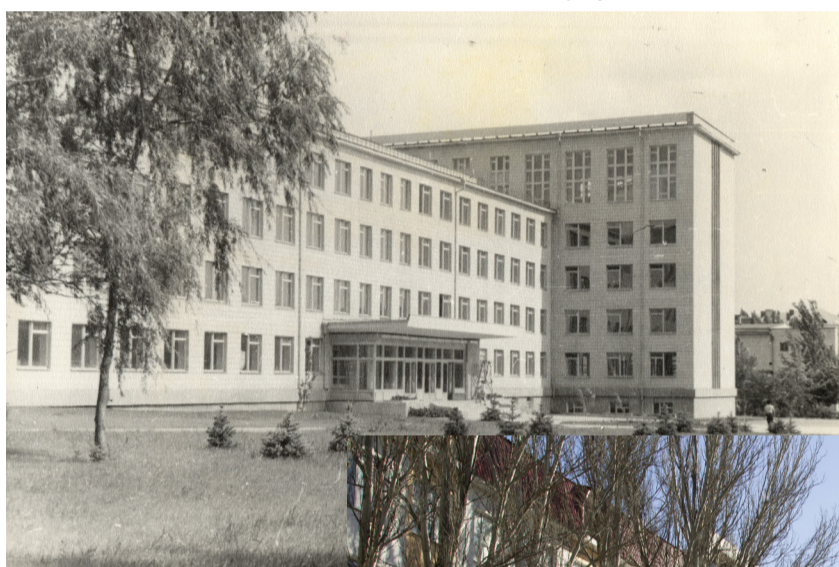
2 корпус, 1970-е годы