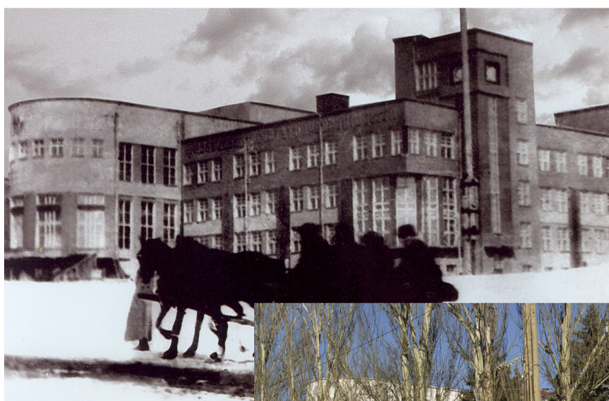
1 корпус ДИНО, 1930 год