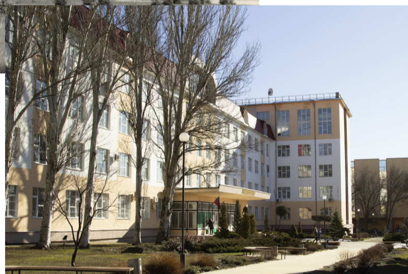
2 корпус, 2022 год