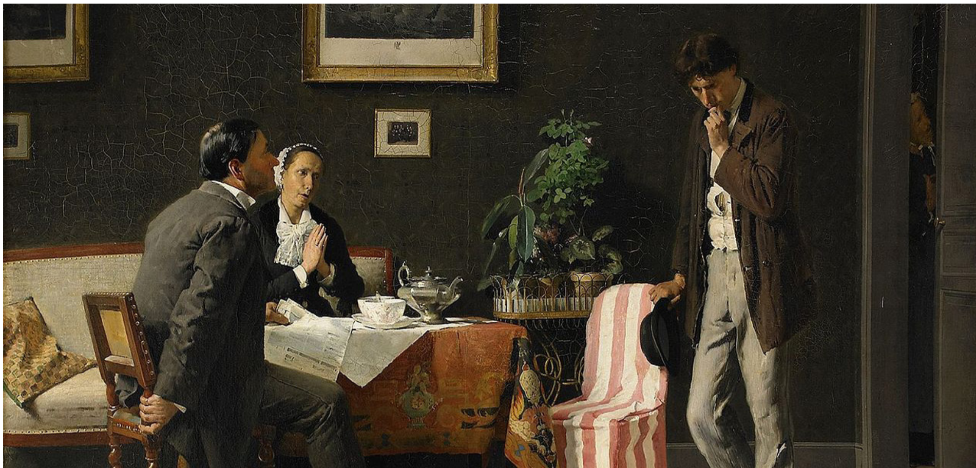
Аксель Кулле. «Возвращение блудного сына», фрагмент, холст, масло. Париж, 1882 г.