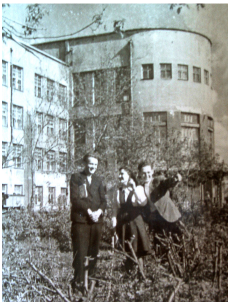
Студенты ЛГПИ, 1949 год