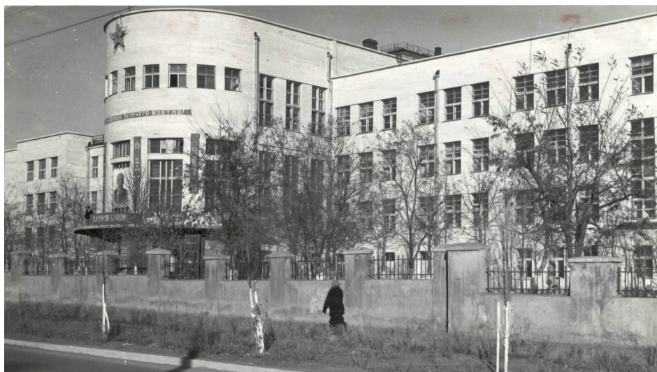
1 корпус, 1950-е годы