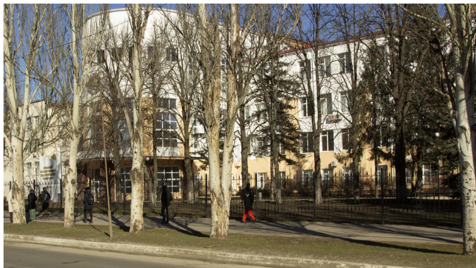
1 корпус ЛГПУ, 2022 год