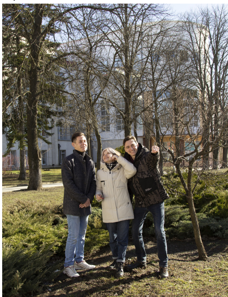
Студенты 2 курса направления подготовки «Журналистика», 2022 год