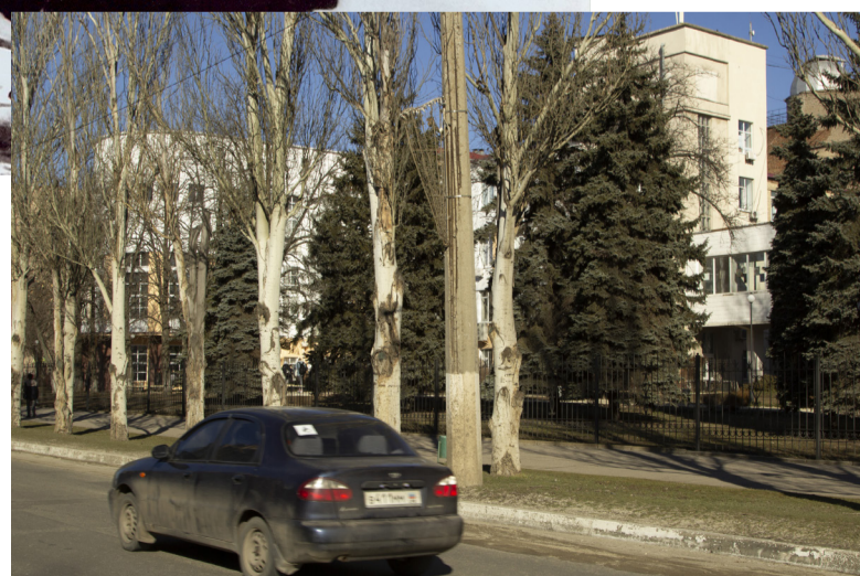
1 корпус ЛГПУ, 2022 год