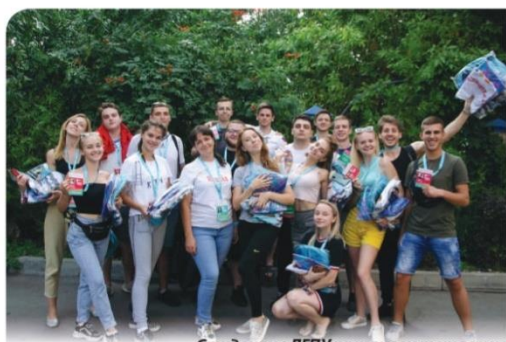
Студенты ЛГПУ принимают участие в фестивале «Российская студенческая весна»