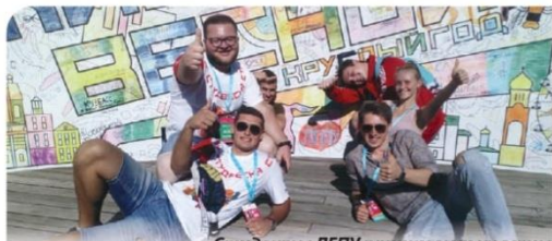
Студенты ЛГПУ принимают участие в фестивале «Российская студенческая весна»

– Я со школы занимаюсь общественной деятельностью. Я привыкла доводить начатое до конца, много работать, уделять внимание общественной