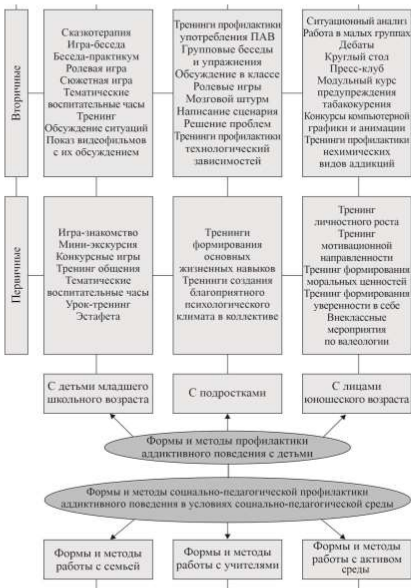
Рисунок 1 – Формы и методы профилактики аддиктивного поведения детей (продолжение)