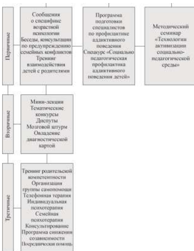
Рисунок 1 – Формы и методы профилактики аддиктивного поведения детей (окончание)

Определено, что для повышения эффективности профилактики аддиктивного поведения детей в традиционную структуру педагогической системы включен ресурсно-средовой компонент. В его основе лежит механизм активизации личностного ресурса ребенка, который осуществляется путем специально организованного профилактического процесса, обустройства жизнедеятельности членов среды в соответствии с их потребностями, что способствует повышению личностного потенциала. Внешние макро-, мезо- и микрофакторы направлены на развитие ресурсов среды, ее социальных