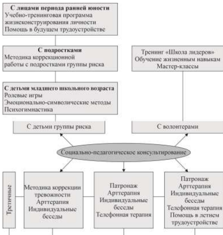
Рисунок 1 – Формы и методы профилактики аддиктивного поведения детей