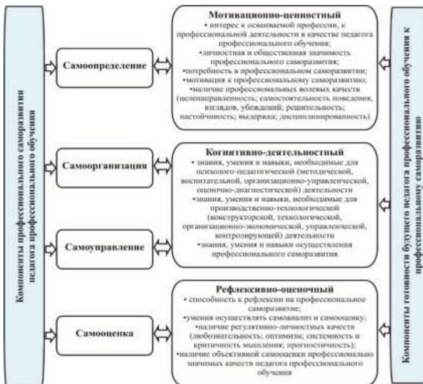
Рисунок 1 – Структура готовности будущего педагога профессионального обучения к профессиональному саморазвитию

обучения к профессиональному саморазвитию были выделены мотивационно-ценностный, когнитивно-деятельностный и рефлексивно-оценочный компоненты (рисунок 1).