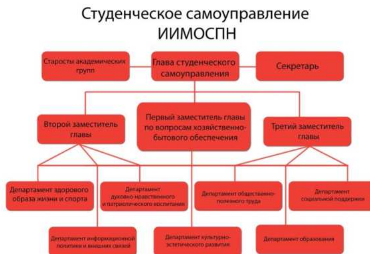
Схема 1 – Структура студенческого самоуправления ИИМОСПН

В ИИМОСПН функционирует студенческое самоуправление, структура которого соответствует структуре органов студенческого самоуправления ЛГПУ (см. схему 1).