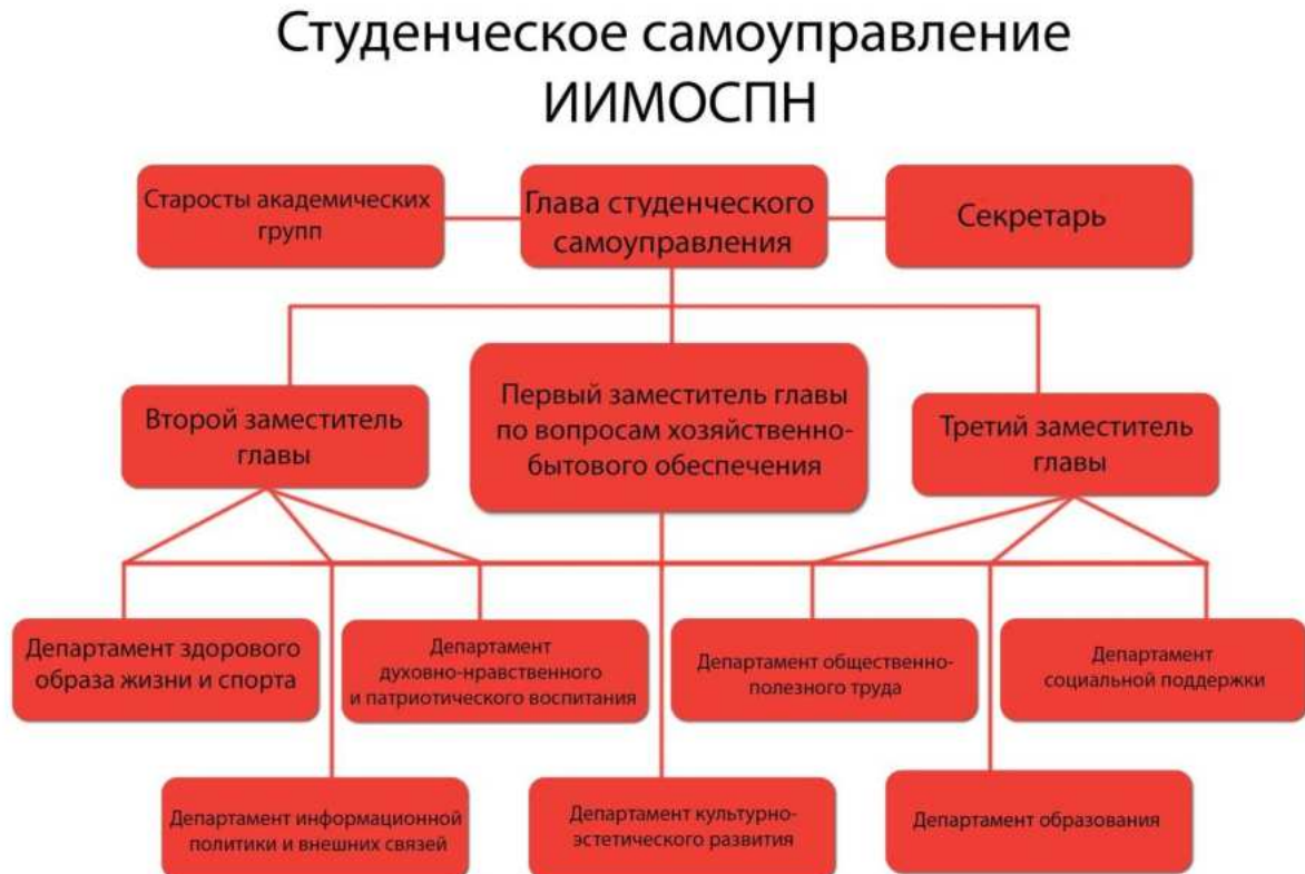
Схема 1 – Структура студенческого самоуправления ИИМОСПН

В ИИМОСПН функционирует студенческое самоуправление, структура которого соответствует структуре органов студенческого самоуправления ЛГПУ (см. схему 1).