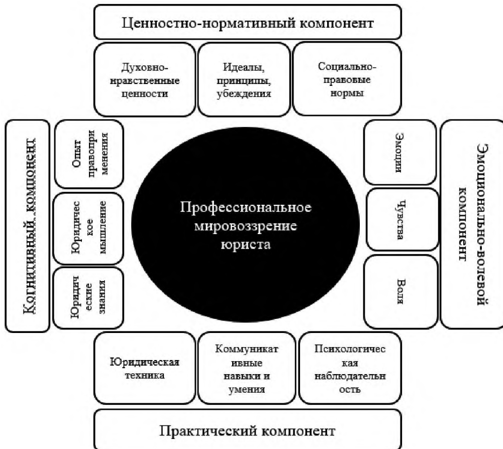
Рисунок 1 – Структура профессионального мировоззрения юриста

в) эмоционально-волевой компонент, представляющий собой совокупность переживаний – чувств, эмоций и актов воления, сопровождающих процессы обучения юридической профессии, самореализации в ней, разрешения профессиональных задач и преодоления трудностей; г) практический компонент, включающий комплекс приёмов, способов, методов и правил юридической техники, которые будущий юрист готов сознательно и эффективно использовать в ходе разрешения стоящих перед ним профессиональных задач, планирования профессиональной деятельности и прогноза ее последствий (рисунок 1).